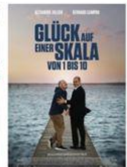
Glück auf einer Skala von 1 bis 10