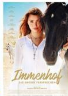
Immenhof – Das große Versprechen